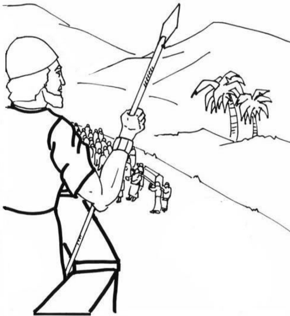
Izraelci obcházejí Jericho