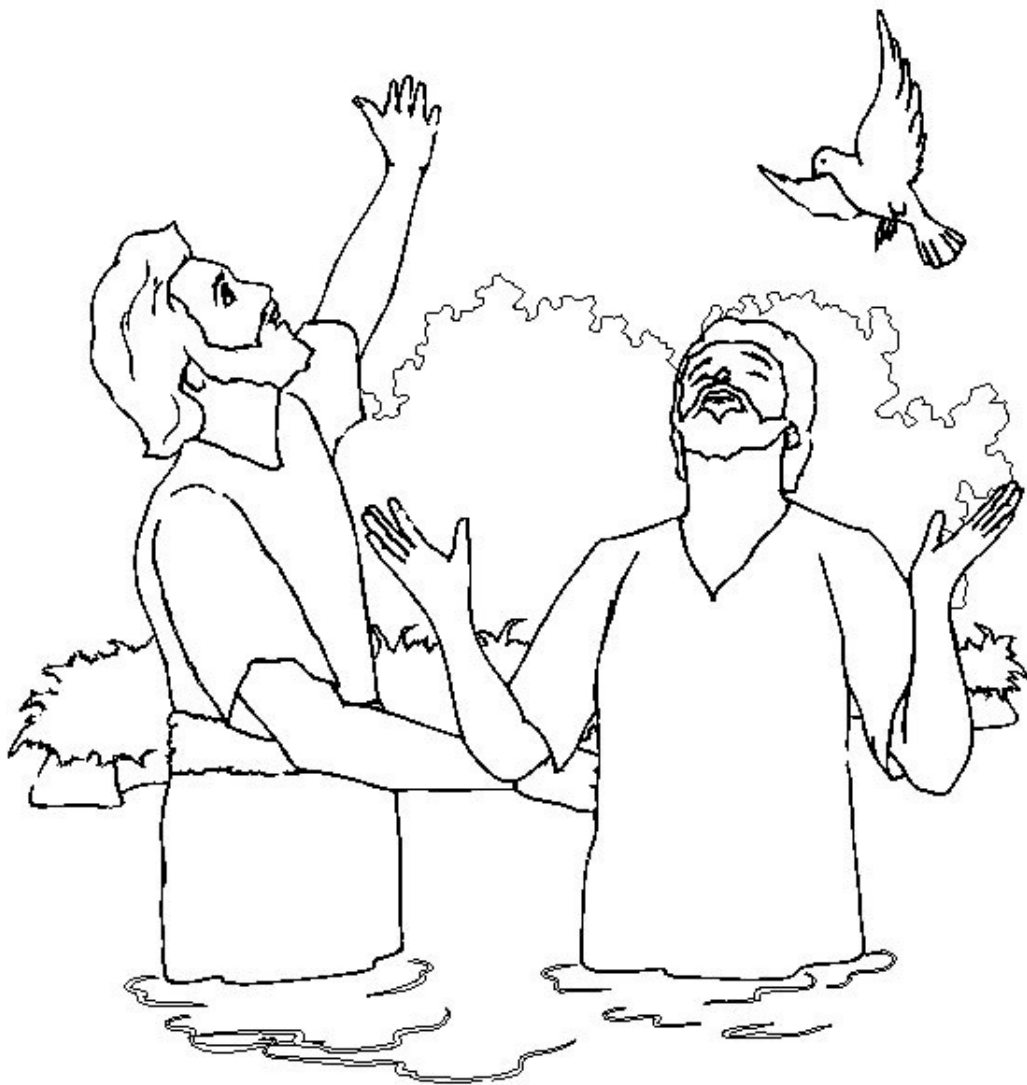
Jan Křtitel křtí Pána Ježíše