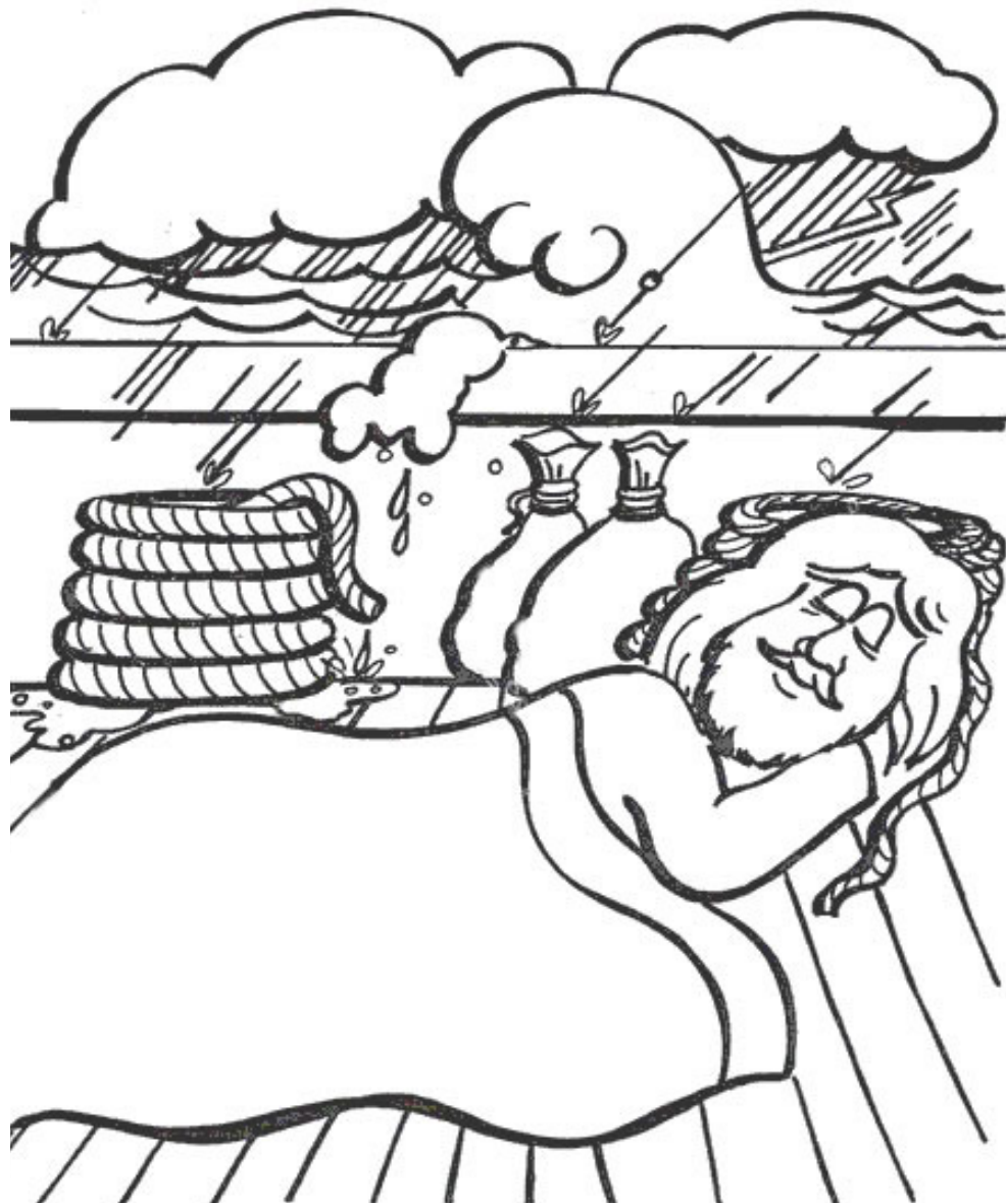
Ježíš spí na lodi